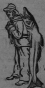
Sin esta Marca Ninguna es Legítima

NO CONTIENE ALCOHOL, GUAYACOL, CREOSOTA NI NINGUNA SUBSTANCIA NO- CIVA O IRRITANTE.